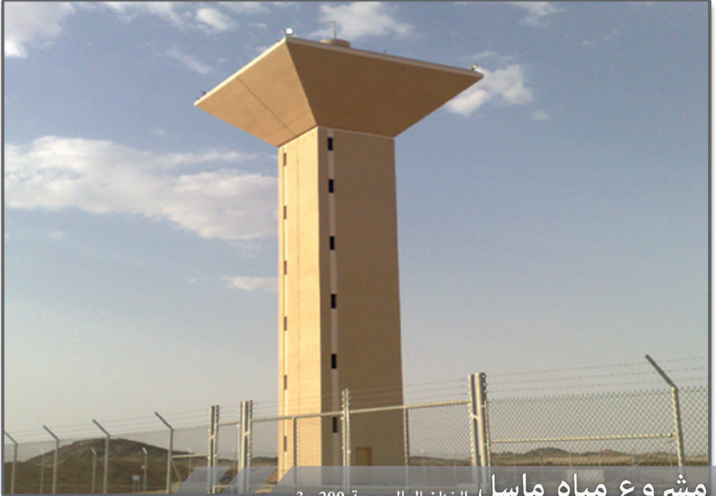
مشروع مياه ماسل الخزان العالي بسعة 200 م 3 الخط الناقل بطول 45 كم الخزان الأرضي بسعة 1,250 م 3