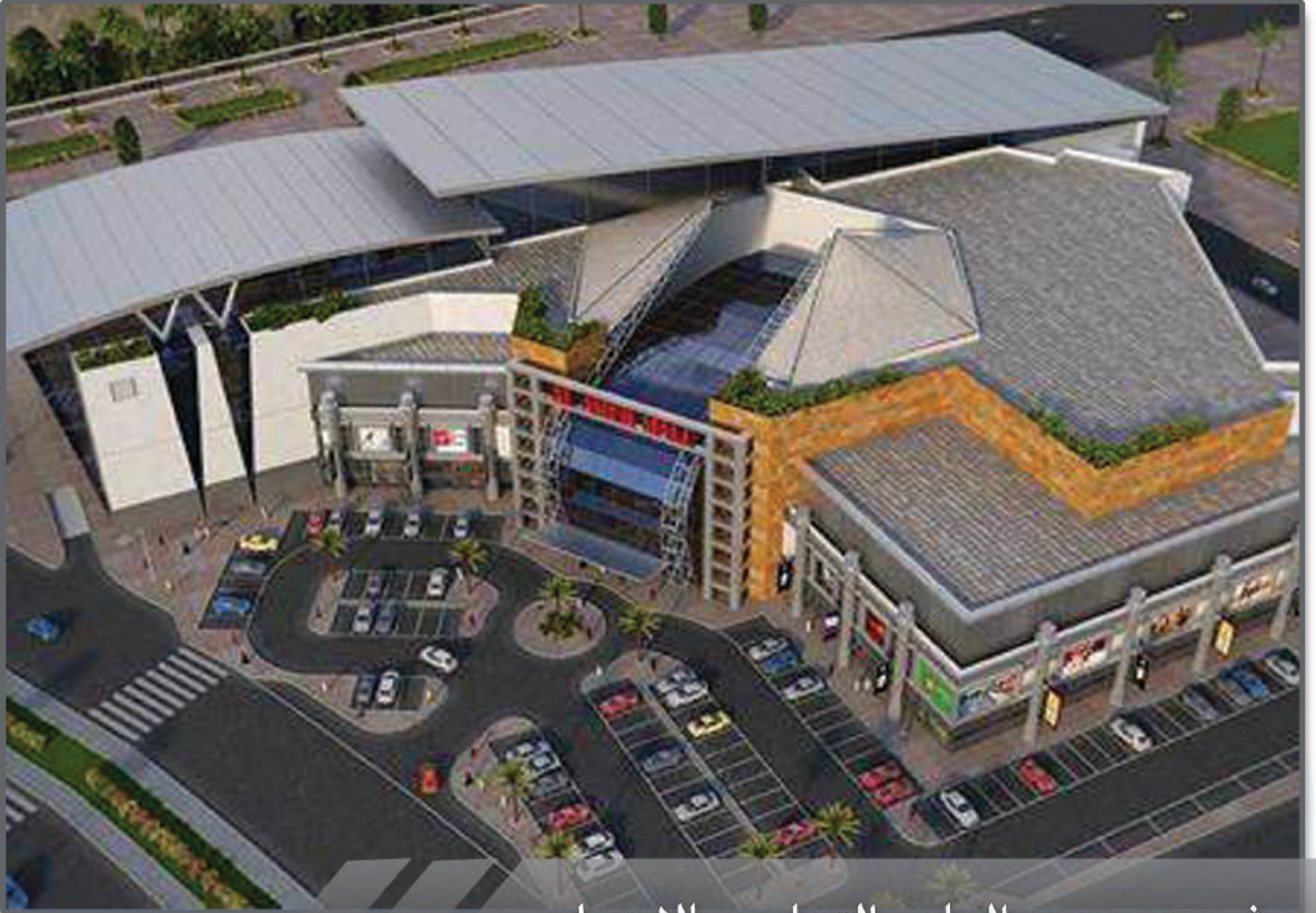
مشروع مجمع العامر التجاري بالاحساء