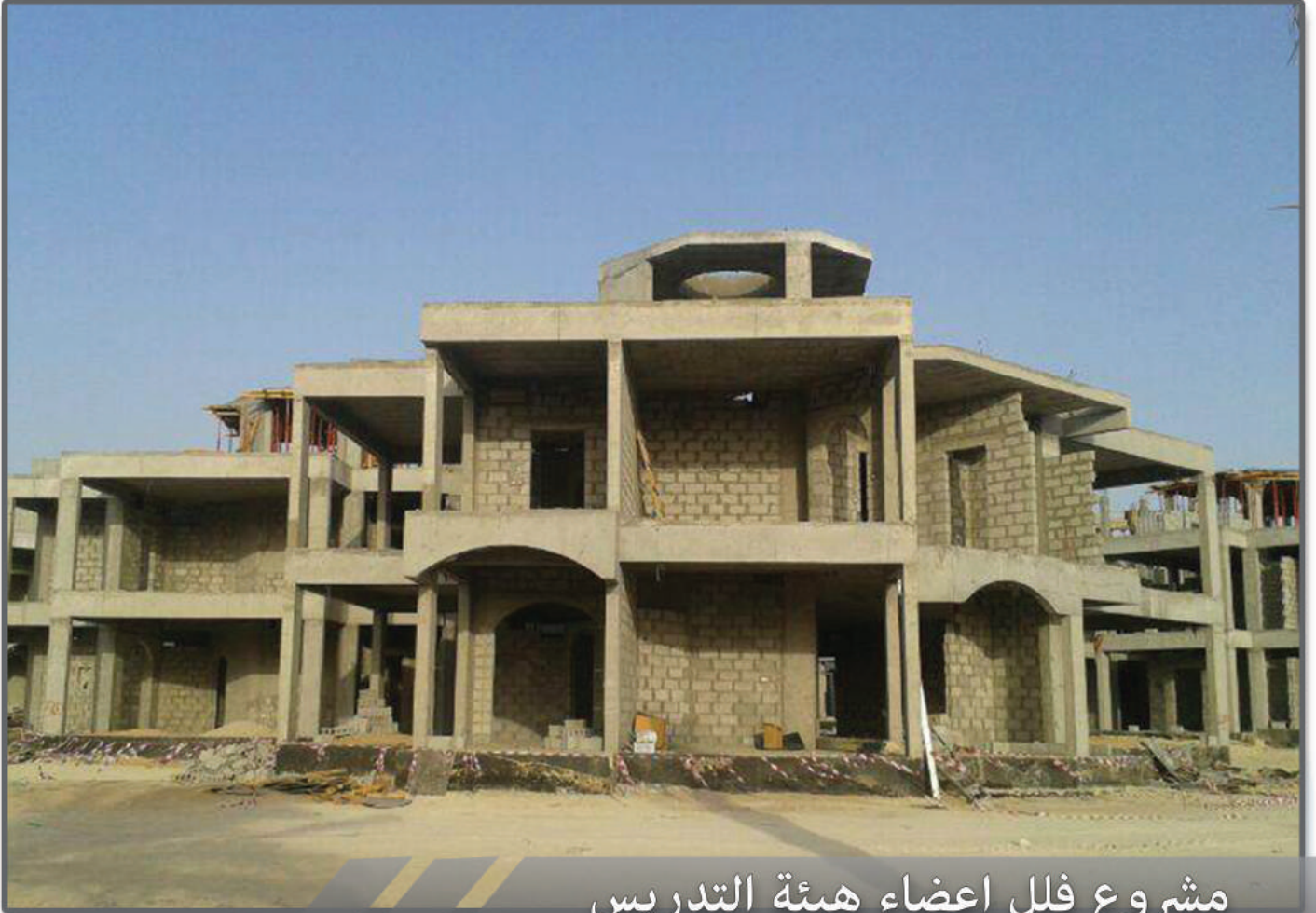
مشروع فلل اعضاء هيئة التدريس جامعة الملك فيصل بالاحساء