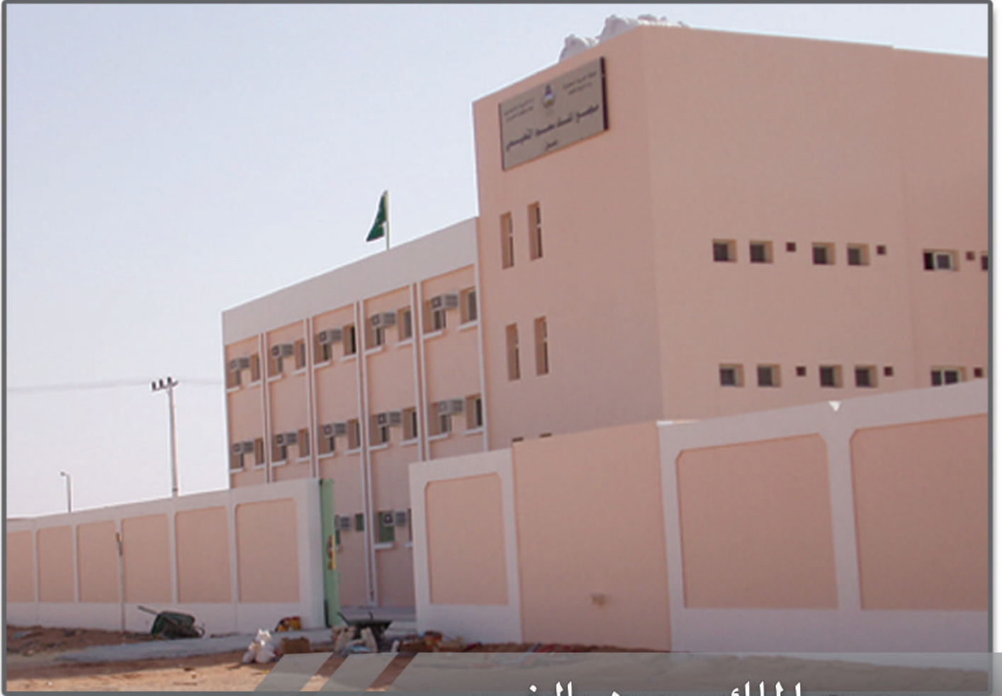
مجمع الملك سعود بالخرج