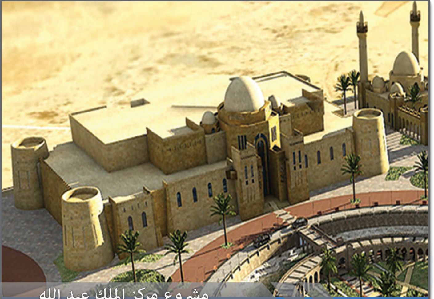
مشروع مركز الملك عبد الله الحضاري بالاحساء - القصر