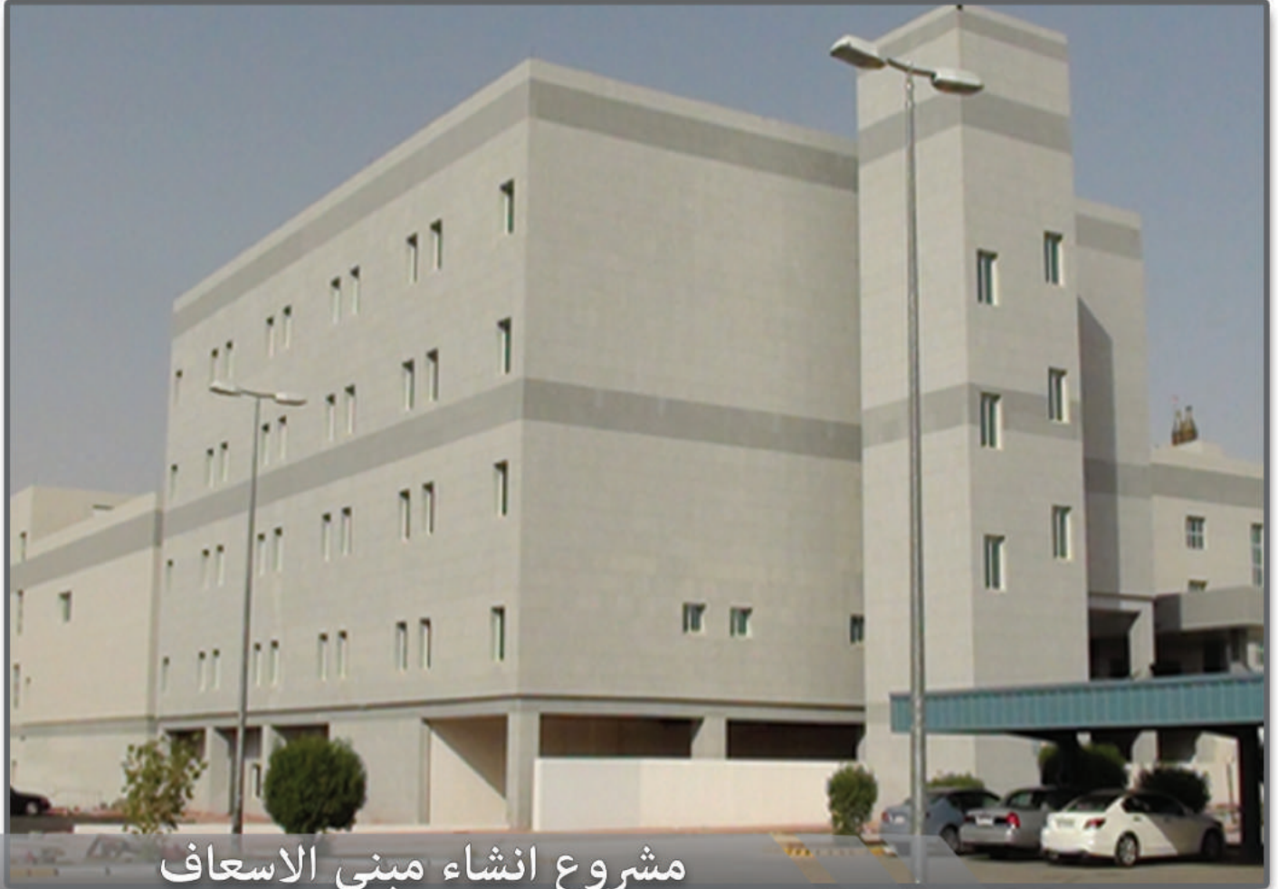
مشروع انشاء مبنى الاسعاف والطوارئ بمستشفى الرس العام