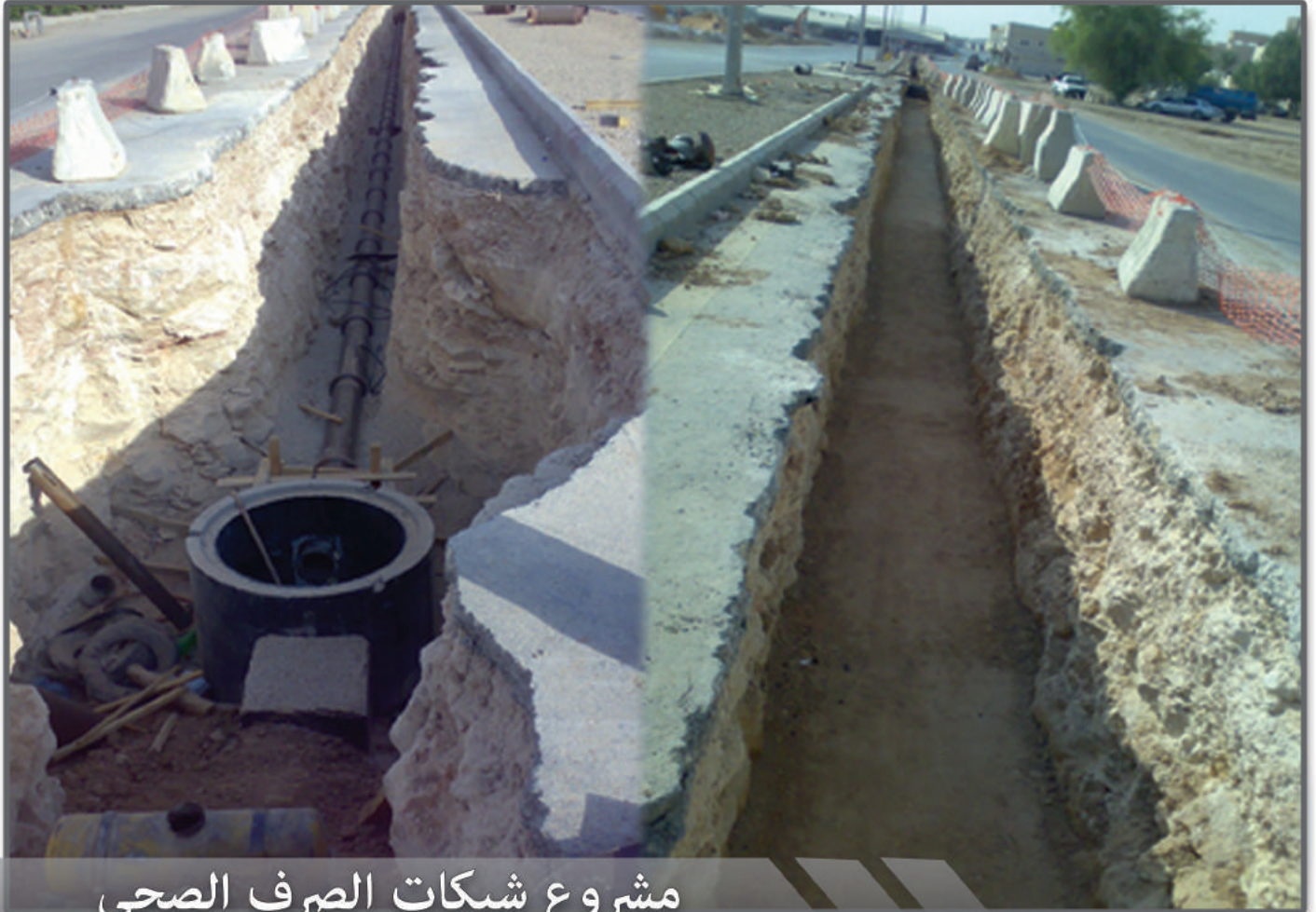
مشروع شبكات الصرف الصحي بجنوب الرياض